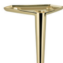
328 Metallfuß gold glänzend