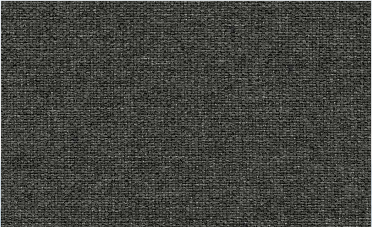
Ocean Waste Clean Impact Textiles® Poseidon Orca 1300