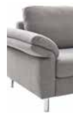
15 22–26 cm (B/L/I)