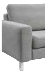
3 19 cm (B/L/I)