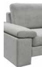
12 26 cm (B/L/I)