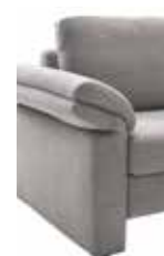
16 22–26 cm (B/L/I)