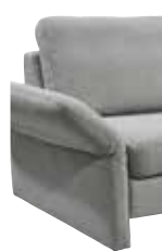
8 12–27 cm (B/L/I)