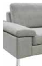
11 26 cm (B/L/I)