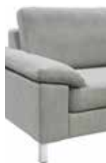
1 22 cm (B/L/I)