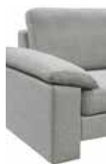
2 22 cm (B/L/I)