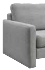
6 13 cm (B/L/I)