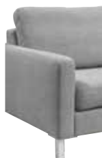
5 13 cm (B/L/I)