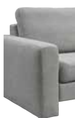
4 19 cm (B/L/I)