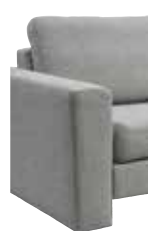
10 19 cm (B/L/I)