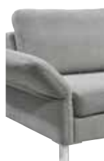
7 12–27 cm (B/L/I)