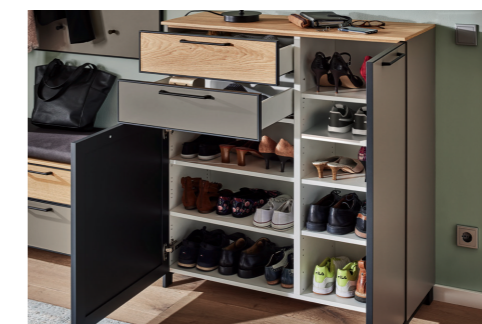
PLATZ FÜR CA. 18 PAAR SCHUHE