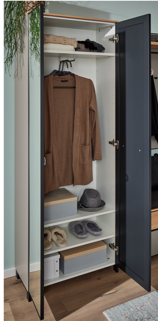
GROSSZÜGIGER DIELENSCHRANK MIT KLEIDERSTANGE UND EINLEGEBODEN