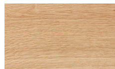
Eiche massiv gebürstet (Frontabsetzungen)