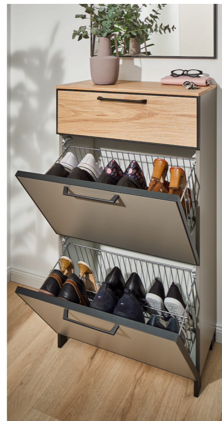
FUNKTIONALER SCHUHSCHRANK MIT KLEINEM PLATZBEDARF

**5 Jahre Garantie auf die Marke Dieter Knoll Collection. Weitere Infos finden Sie unter www.dieterknoll-collection.com .