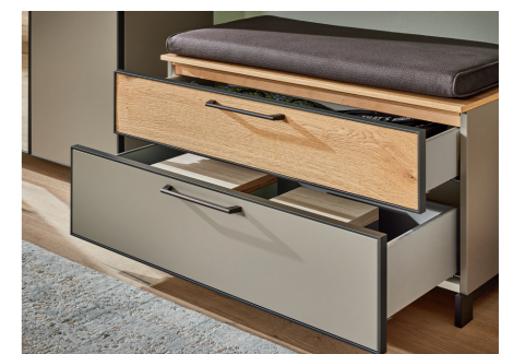
KOMFORTABLE GARDEROBENBANK MIT SCHUBKÄSTEN