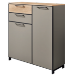
Schuhkommode 2 schmale Schubkästen und 2 Türen, B/H/T: ca. 100 x 107 x 37 cm, wahlweise auch mit 1 breitem Schubkasten und 2 Türen, B/H/T: ca. 84 x 107 x 37 cm