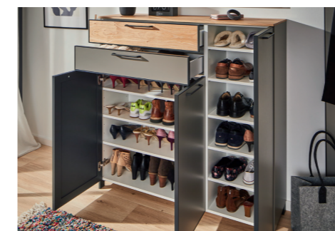
PLATZ FÜR CA. 28 PAAR SCHUHE