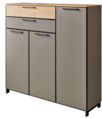
Schuhkommode 2 Schubkästen und 3 Türen B/H/T: ca. 125 x 123 x 37 cm