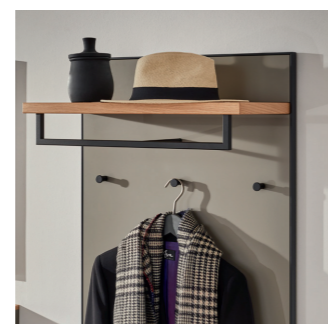
PANEEL MIT KLEIDERSTANGE UND HAKEN AUS METALL