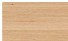
Eiche furniert (Deckblatt/Hutablage)