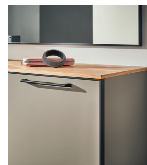
ABDECKPLATTE AUS HOCHWERTIGEM EICHEN-FURNIER

Mit Cando wird Ihr Eingangsbereich modern, funktional und hochwertig in Szene gesetzt. Die Garderobenmöbel sind im ansprechenden Farbton Fango lackiert. Frontabsetzungen in massiver, gebürsteter Eiche, Metallkufen und umlaufende, anthrazitfarbige Gehrungsrahmen setzen dazu besondere Akzente. Klug konzipierte Stauraummöbel ergänzen sich hier bestens mit Paneelen und Spiegeln, sodass Ihr neues Garderobensembel individuell auf Sie und Ihre Bedürfnisse abgestimmt werden kann.