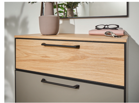
FRONTABSETZUNG AUS MASSIVER EICHE